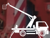
PIATTAFORME AEREE AUTOCARRATE