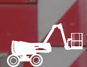
PIATTAFORME AEREE ARTICOLATE