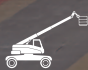
SOLLEVATORI TELESCOPICI FRONTALI