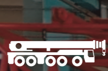
AUTOGRÙ ALL TERRAIN