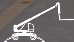
SOLLEVATORI TELESCOPICI ROTATIVI